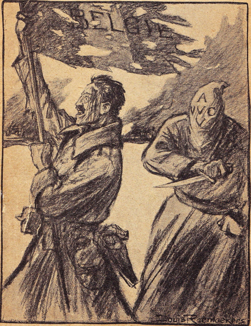
Een « Front » aanval.